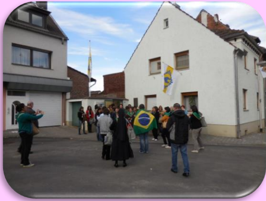
Geburtshaus von Pater Kentenich in Gymnich, Kunibertusplatz 9