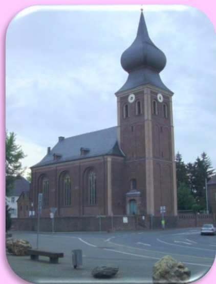
Taufkirche von Pater Kentenich St. Kunibertus, Gymnich