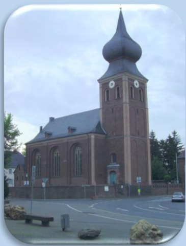
Taufkirche von Pater Kentenich St. Kunibertus, Gymnich