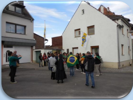
Geburtshaus von Pater Kentenich in Gymnich, Kunibertusplatz 9