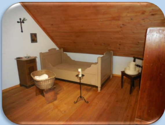
Geburtskammer von Pater Josef Kentenich